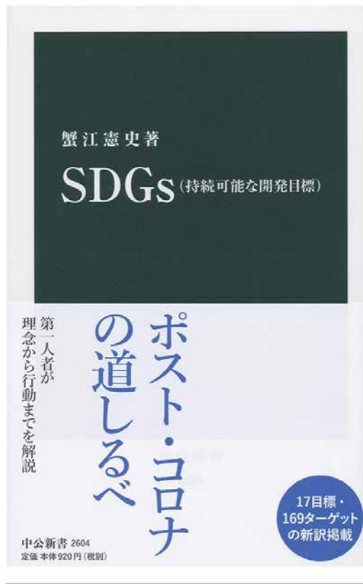
SDGs (持続可能な開発目標) (中公新書) 2020/08/25 蟹江憲史